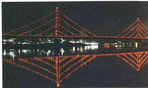
斜張橋のクリスマスツリー