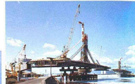
主桁の張り出し架設